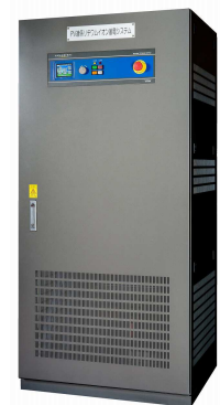
YRW シリーズ製品写真