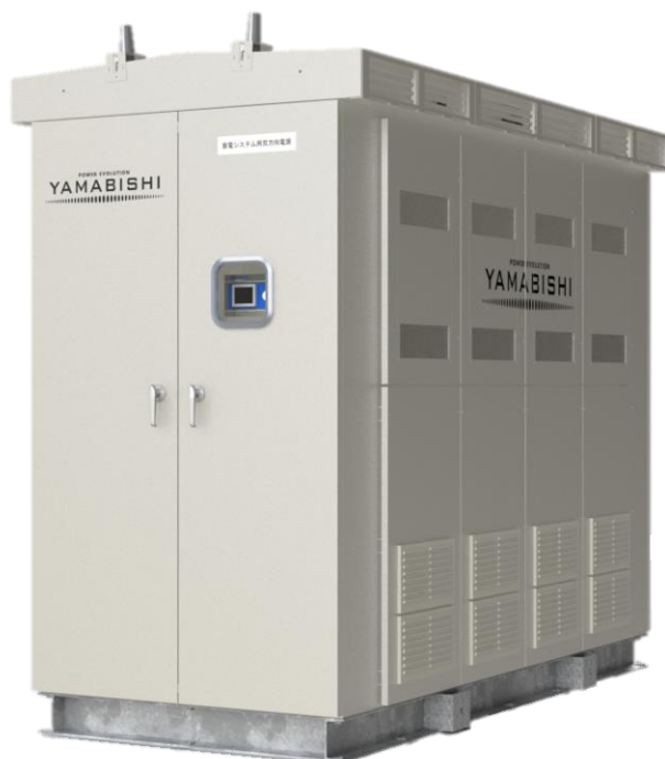
<屋外に直接設置可能な YRW 2000 シリーズ>

2019年以降、再エネ達成率40%前後(全営業・製造拠点合算値)を継続的に実現している当社では、上記システムと制御を活用し、自家消費を行っております。